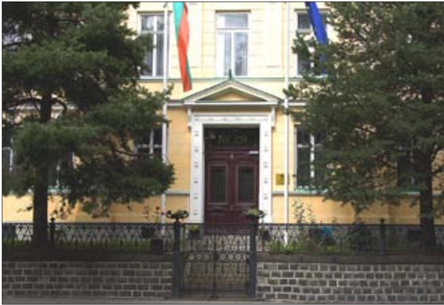
Посолството на РБ в Стокхолм, ул. „Карлавеген“ № 29.

От грамата, изпратена от българското посолство в Стокхолм, става ясно, че това е поредна измама за предлагане на работа зад граница. Лицето, което е предложило заетост на потърпевшите, и ги е извозило до Швеция, се е пред-