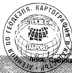
Схема № 15-1012975-15.09.2021 г. издадена въз основа на заявление с входящ № 01-513306-14.09.2021 г.

Носители на други вещни права по данни от КРНИ: няма данни