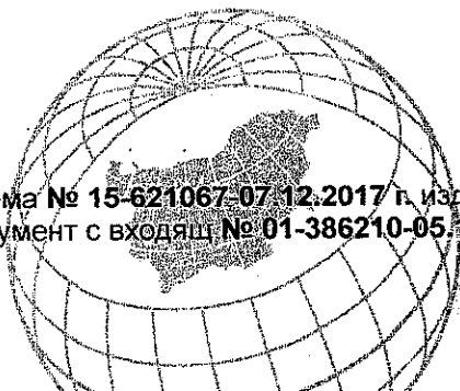
Схема № 15-621067-07.12.2017 г. издадена въз основа на документ с входящ № 01-386210-05.12.2017 г.

Акт за частна общинска собственост № 191 том 9 рег. 3492 от 20.11.2017г., издаден от АВ - СЛУЖБА ПО ВПИСВАНИЯТА - ГР. ГАБРОВО