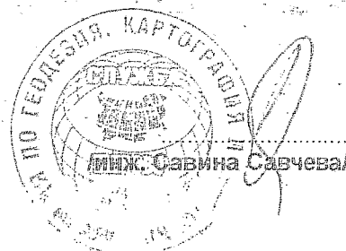
Схема № 15-1057763-11.11.2020 г. издадена въз основа на заявление с входящ № 01-493156-22.10.2020 г.

Акт за частна общинска собственост № 829 от 10.04.2001г., издаден от ОБЩИНА ГАБРОВО