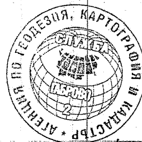
Схема № 15-163675-16.02.2021 г. издадена въз основа на заявление с входящ № 01-81745-15.02.2021 г.