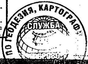
Схема № 6363 / 05.10.2012 г. е издадена въз основа на документ с входящ № 88-53-15 / 03.10.2012 г.